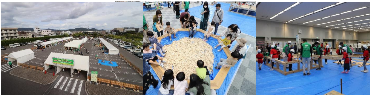
『2022 ウッディフェスティバル開催風景』

木材利用促進月間中の10月7日と8日（木材利用促進の日）の2日間、環境と人に優しい県産木材の普及啓発や地域材（香川県産認証ひのき）の需要拡大と品質性能の明確なJAS構造材の普及広報活動を行い、森の資源の循環利用を通じて持続可能な社会を築くために、構成団体9団体が一丸となり、事業に取り組みます。